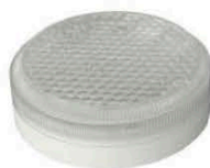
Исполнение 4, диаметр 150мм ЛУЧ-12-С 34/64, ЛУЧ-24-С 34/64, ЛУЧ-36-С 64, ЛУЧ-220-С 34/64, =12/=24/~36/~220В, 3/6Вт, 460/800Лм, 4000К (3000/5700 К под заказ)