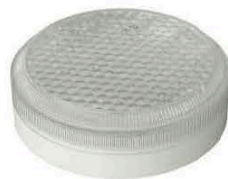
Исполнение 3, диаметр 180мм ЛУЧ-220-С 63, ЛУЧ-220-С 83, ЛУЧ-220-С 103 ~220В, 6/8/10Вт, 850/1050/1300Лм, 4000К (3000/5700 К под заказ)